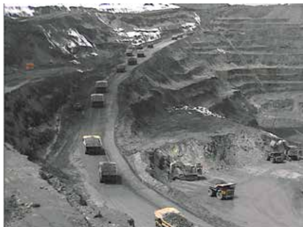
Rys. 2. Transport urobku z wyrobiska

Eksploracja prowadzona jest w wyrobisku stokowo-wgłębnym, wielopoziomym systemem ścianowym z równoległym postępowaniem frontów eksploatacyjnych jednocześnie na kilku poziomach, których wysokość wynosi do 12 m (rys. 2). Masy skalne urabiane są poprzez zastosowanie robót wiertniczo-strzałowych. Nadkład usuwany jest przez koparki przedsiębierne i następnie wywożony jest na zwałowisko zewnętrzne transportem kołowym, pojazdami technologicznymi CAT 789C i D, o pojemności skrzyni ładunkowej 128 ton. Otrzymana złotonośna ruda przewożona jest do zakładu kruszenia wstępnego, skąd trafia przenośnikiem taśmowym na młyny i po odpowiednim rozdrobieniu do huty, gdzie poddawana jest procesowi flotacji.