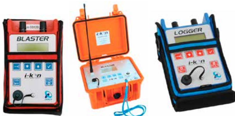
Rys. 4. Składowe urządzenia systemu Ikon II

System I-kon II zachowuje wiele kluczowych rozwiązań technologicznych swojej pierwotnej wersji, jednak dotychczasowe doświadczenia w stosowaniu pozwoliły na wypracowanie jeszcze bardziej optymalnych rozwiązań do których należą: