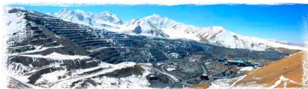
Rys. 1. Kopalnia złota Kumtor

Od początku funkcjonowania, czyli od 1997 roku, do końca 2012 roku kopalnia wyprodukowała ponad 8,6 milionów uncji złota, zatrudniając w chwili obecnej blisko 3500 pracowników. O tym jakie znaczenie dla gospodarki Kirgistanu ma omawiane przedsięwzięcie świadczy fakt, że działalność kopalni to 10% PKB, oraz 46% całej produkcji przemysłowej kraju.