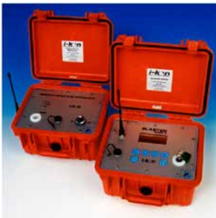
Rys. 6. System SURBS i zapalarka Blaster 2400

Wielkość wydobycia w kopalni wiąże się z koniecznością stosowania bardzo dużej ilości maszyn i sprzętu w wyrobisku. Aby zachować odpowiednio dużą wydajność eksploatacyjną, niezbędnym jest uzyskiwanie efektów robót strzałowych na bardzo wysokim poziomie. Konieczne jest zatem zminimalizowanie przerw w wydobyciu związanych z prowadzeniem robót strzałowych. Dla lepszej koordynacji prowadzonych prac w kopalni stosowany jest bezprzewodowy system odpalania SURBS produkcji firmy Orica (rys. 6).